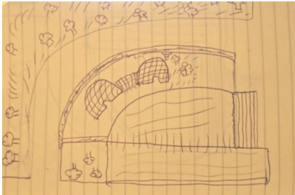
REPRÉSENTATIONS DU SITE PAR LE DESSIN D'UN ENFANT. ÉMERGENT LES ÉLÉMENTS DE SURFACE TACTILE: EAU, VÉGÉTATION, MURS DÉLIMITANT, KHETARRAS DONNANT UN «VOLUME LUDIQUE» À L'ESPACE.

amie l'accueille par quelques éclaboussures qui déclenchent des fous rires, les garçons sont alors prêts à se mêler au jeu. Derrière, assises contre le soubassement en pierre sèche du mur mitoyen, certains habitants du quartier profitent, avant la tombée du jour, d'une ombre providentielle et de l'attrait irrésistible que procure l'eau qui semble renaître d'elle-même. Les mères parlent entre elles et