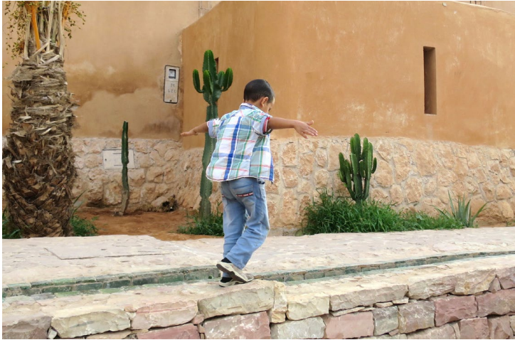
SURFACE D'APPUI [JOUER].

acrobaties et autres activités, si nombreuses, avec l'eau. La fonctionnalité des éléments d'architecture est débordée de toute part par l'investissement créatif de l'enfant. Le garde-corps circulaire qui entoure la source devient surface d'appui où l'on grimpe et depuis lequel prendre son élan pour sauter sous le regard des autres. Le lieu prend vie par l'intermédiaire de cette disponibilité affective et de cette spontanéité motrice de l'enfant, l'architecture en potentialise l'émergence. La présence de l'eau soulève une force d'attraction et donne un fondement corporel particulier à l'espace commun.